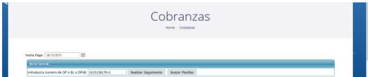
Figura 12. Interfaz para realizar consultas de Cobranzas

En esta interfaz se puede observar dos botones: Realizar Seguimiento y Buscar Planillas, a continuación, explicaremos cada una de estas opciones.