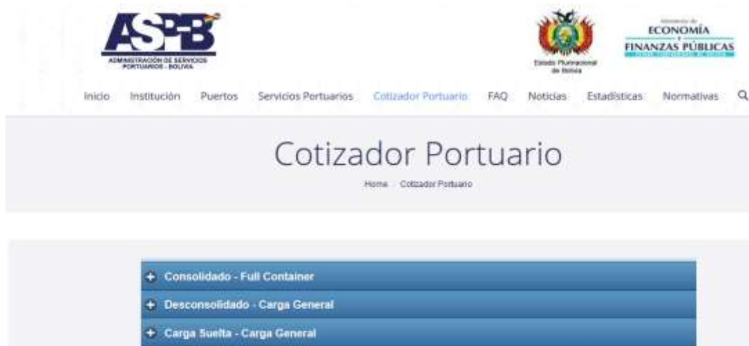
Figura 18. Cotizador Portuario

Esta opción se utiliza para realizar cotizaciones de importación de mercadería de acuerdo a los 3 tipos de Despacho: FCL, Desconsolidado y LCL, (ver figura 18).