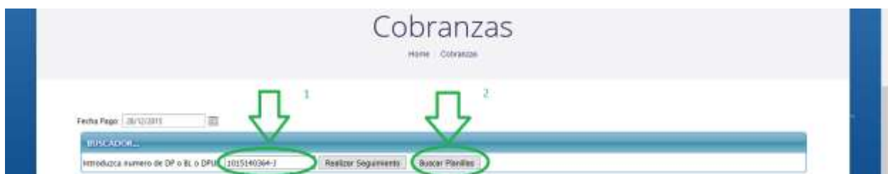
Figura 13. Búsqueda de Planillas

Esta opción se utiliza para buscar planillas de un DPUB, para realizar la búsqueda de planillas se debe introducir el número de DPUB en el campo de texto, ver figura 13