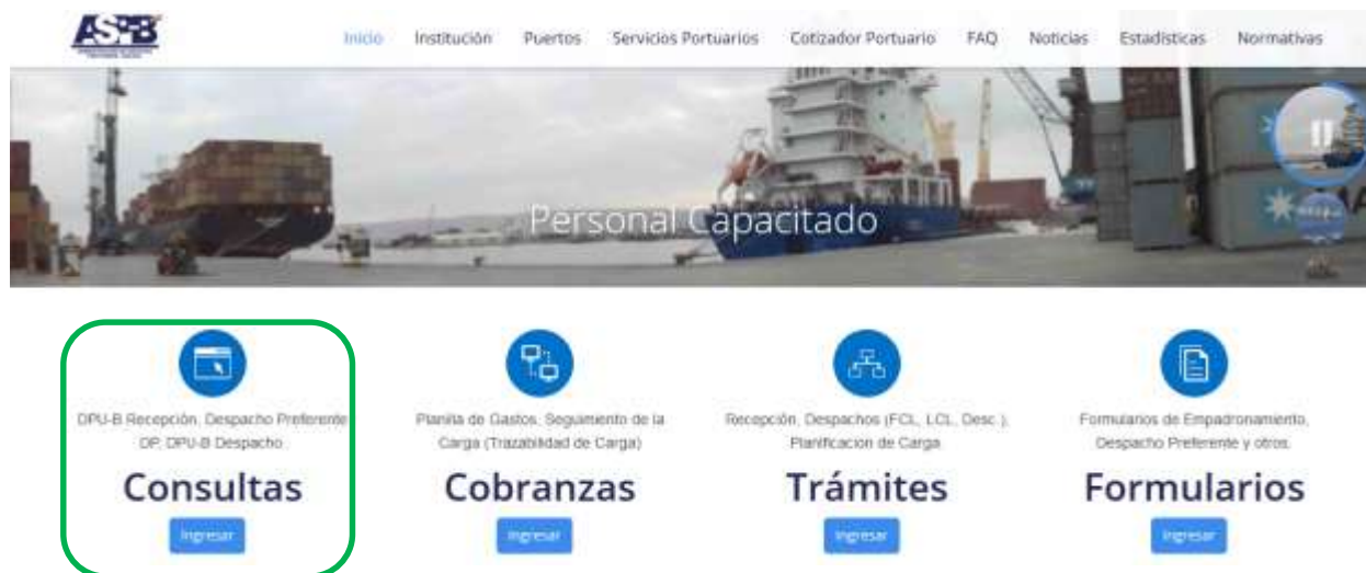
Figura 1 – Interfaz Principal

En la figura 1 se muestra el interfaz principal del usuario, al presionar el botón “Consultas” se desplegará la interfaz para realizar consultas (ver figura 2)