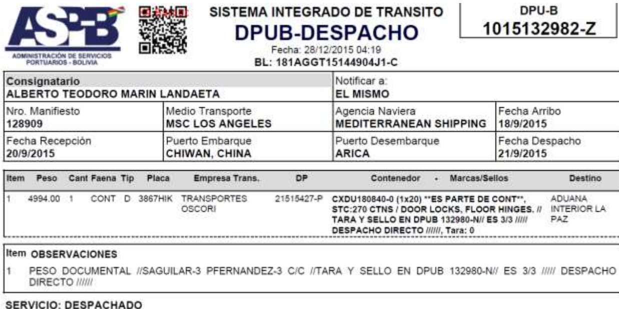
Figura 10. DPUB de Despacho