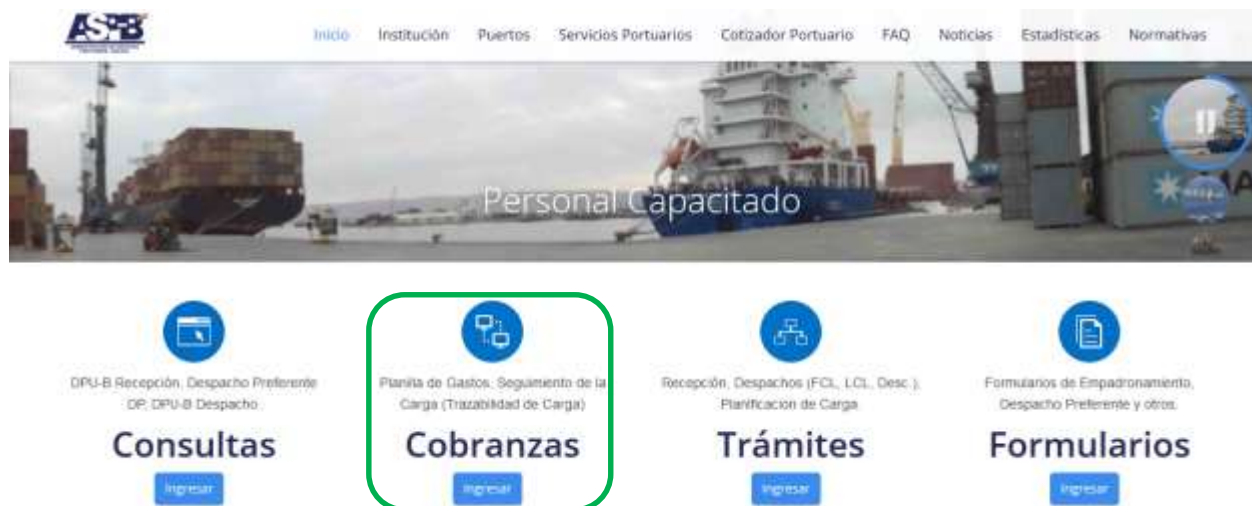
Figura 11 – Interfaz Principal

La figura 11 se muestra el interfaz principal del usuario, al presionar el botón “Cobranzas” se desplegará la interfaz para realizar nuestra consulta (ver figura 12)